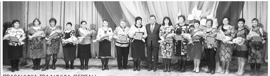
ПРАЗДНИКИ, ТРАДИЦИИ, ОБРЯДЫ